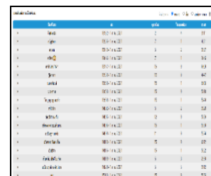
ภาพที่ 4 ผลลัพธ์คะแนนของผู้เล่น