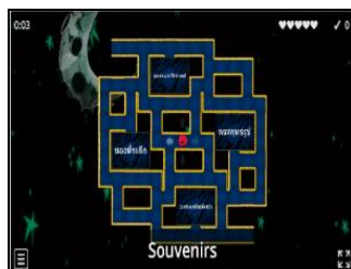
ภาพที่ 3 ตัวอย่างเกมไล่ล่าเขาวงกต