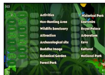
ภาพที่ 2 ตัวอย่างเกมจับคู่